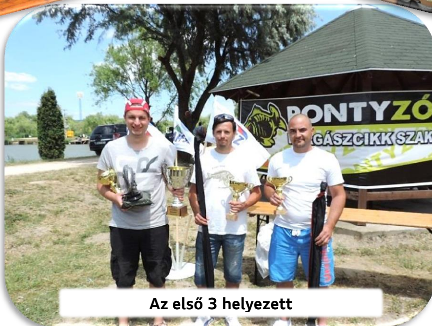
Az első 3 helyezett